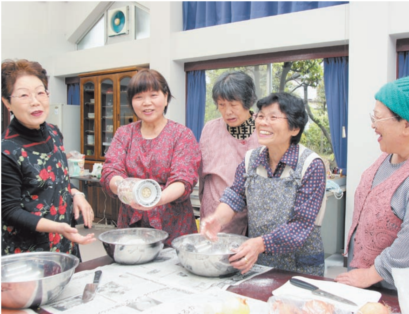
埼玉協同病院東地区根岸支部では毎月1回、ミニデイサービスを団地の集会所を利用して、楽しくおこなっています。この日は「ホウ酸ダンゴでゴキブリ退治」ということで、せっせとホウ酸ダンゴをつくりました。おしゃべりと笑顔の絶えない集まりです。

●1部30円(組合員の購読料は出資金に含まれています) ♻️100 古紙配合率100%再生紙(エコマーク取得)を使用しています