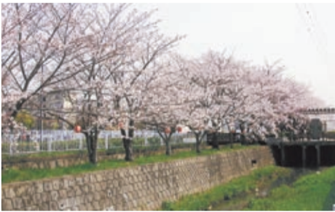
さくら通りの名のとおり、春にはきれいな桜並木

今回は新興住宅街のきよみ野地区にある永田公園に案内します。 JR吉川駅北口からまっすぐ北にのびる、いちよう並木の新緑を眺めながら市役所に向かって進んでいきます。保健センターが左に見えたらその先を右折します。しばらく進むと右側に円形の市民交流センター「おあしす」が見えます。こ