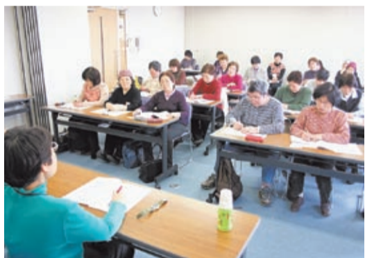
西部地域で開かれた子育てサポーター養成講座

1回目は、大井協同診療所の事務長(管理栄養士)のお話で食中毒の予防。2回目は、医師に、夏にかかりやすい子どもの病気について話してもらいました。努力の